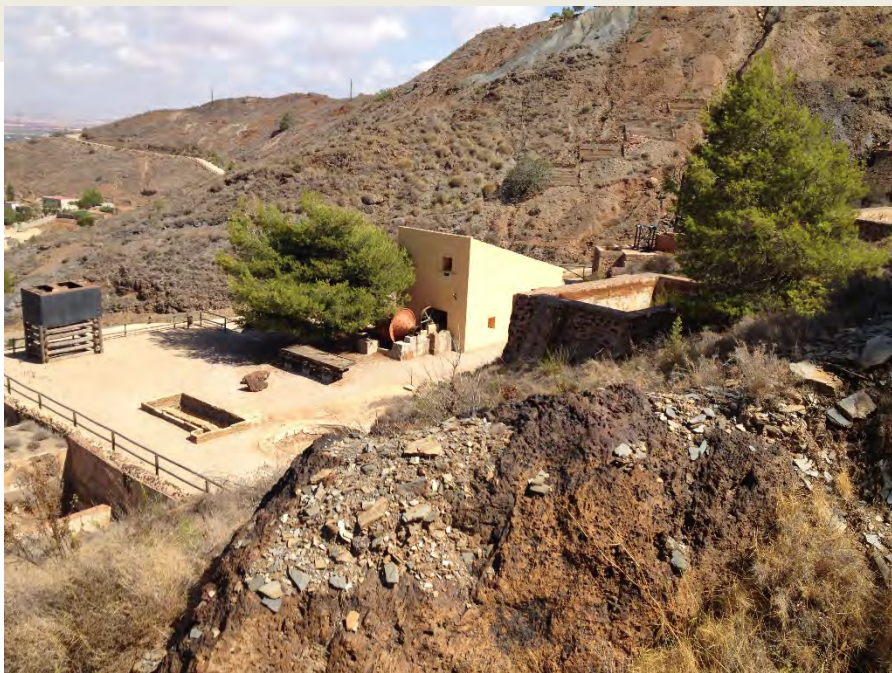
Es posible obtener licencia en construcciones ilegales

El Tribunal Supremo admite la resolución de contratos de compraventa por aplicación de la cláusula rebus sic stantibus , pero siempre con un carácter muy restrictivo. Considera que la petición de resolución no puede fundamentarse solo en la crisis que provoca dificultades de financiación y que hay que valorar otros factores, como si es primera vivienda o vacacional, si el vendedor es profesional del sector inmobiliario o particular o la necesidad de comparar la situación económica del comprador antes y después de la firma del contrato privado. En definitiva, no puede afirmarse que la crisis económica producida por la pandemia sea motivo suficiente para resolver el contrato de compraventa y habrá que tener en cuenta otros factores.