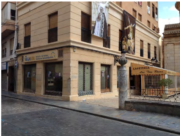
El cambio de circunstancias por la pandemia hace posible la modificación o resolución del arrendamiento de local de negocio.

En el plazo establecido en los Reales Decretos que regulan la moratoria, el inquilino tendrá que solicitarla al arrendador. Debemos tener en cuenta que no se trata de una condonación, sino que se va a posponer su pago, prorrateándolo por meses hasta un máximo de dos años si es local de negocio o tres años si es vivienda, o bien hasta que esté vigente el arrendamiento.