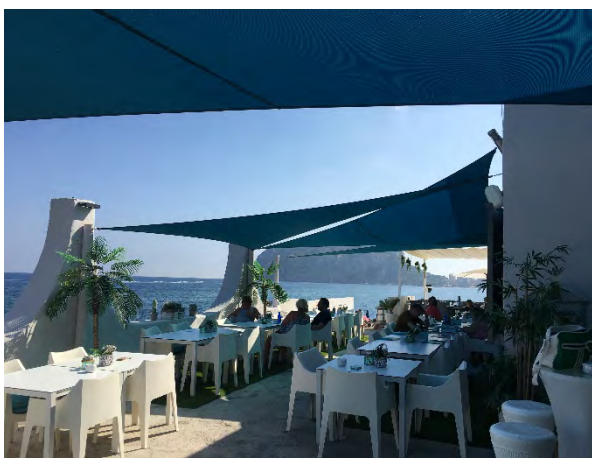
Los negocios que se han visto obligados a cerrar pueden solicitar la moratoria para el pago de la renta de alquiler.