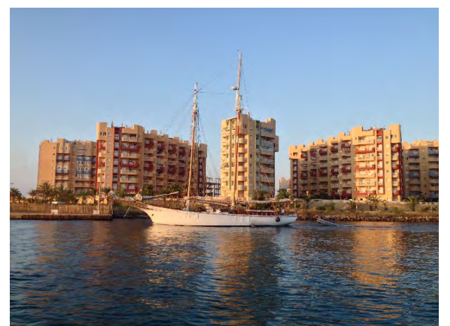
El valor refugio que representa la inversión inmobiliaria puede atraer el capital después de la pandemia.

Precedente de China. La venta de viviendas ya ha recuperado los niveles de 2018.